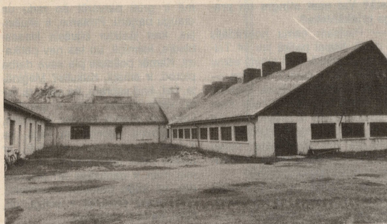
Skats uz cehu no sargu mājas.

Šāgada sākumā četri īpašnieki nodibināja SIA «Pitragss», kura maljā sāka darbu un kurā tagad ir nodarbināti 30 strādājošie. Uzņēmuma nosaukumā vārdam «Pitragss» otrs burts «s» pielikts tāpēc, ka pēc noteikumiem nedrīkst reģistrēt uzņēmumu, kas nosaukts apdzīvotās vietas vārdā. Paši neatlaidīgākie šo prasību mēcējuši apiet, Mēlnsilā, piemēram, ir SIA «Mēlnsilis».